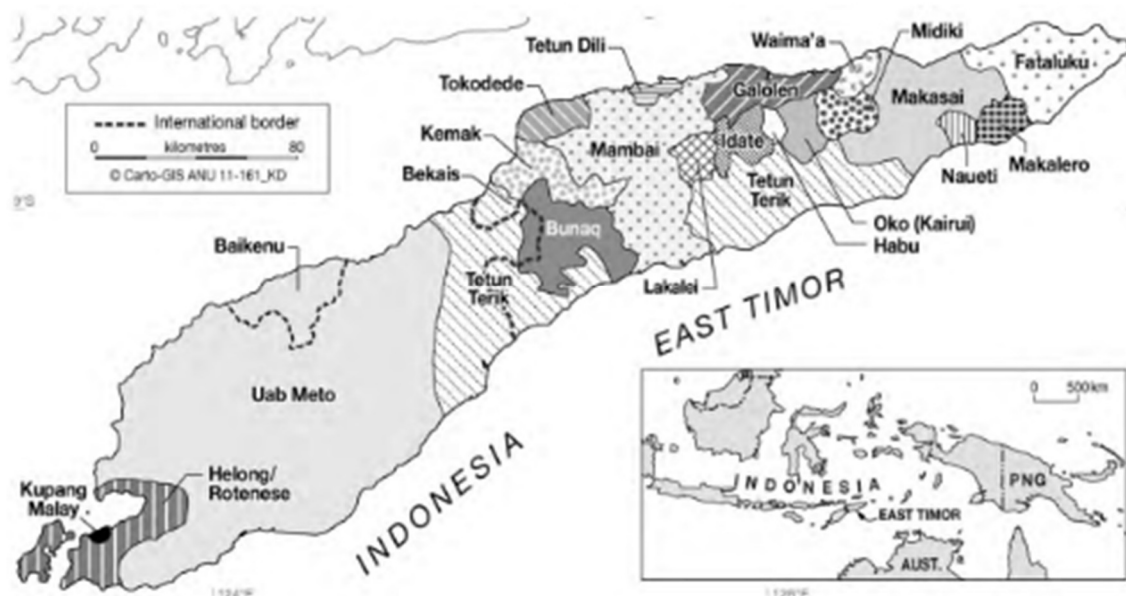
Figura 2 – Mapa etnolinguístico da ilha de Timor