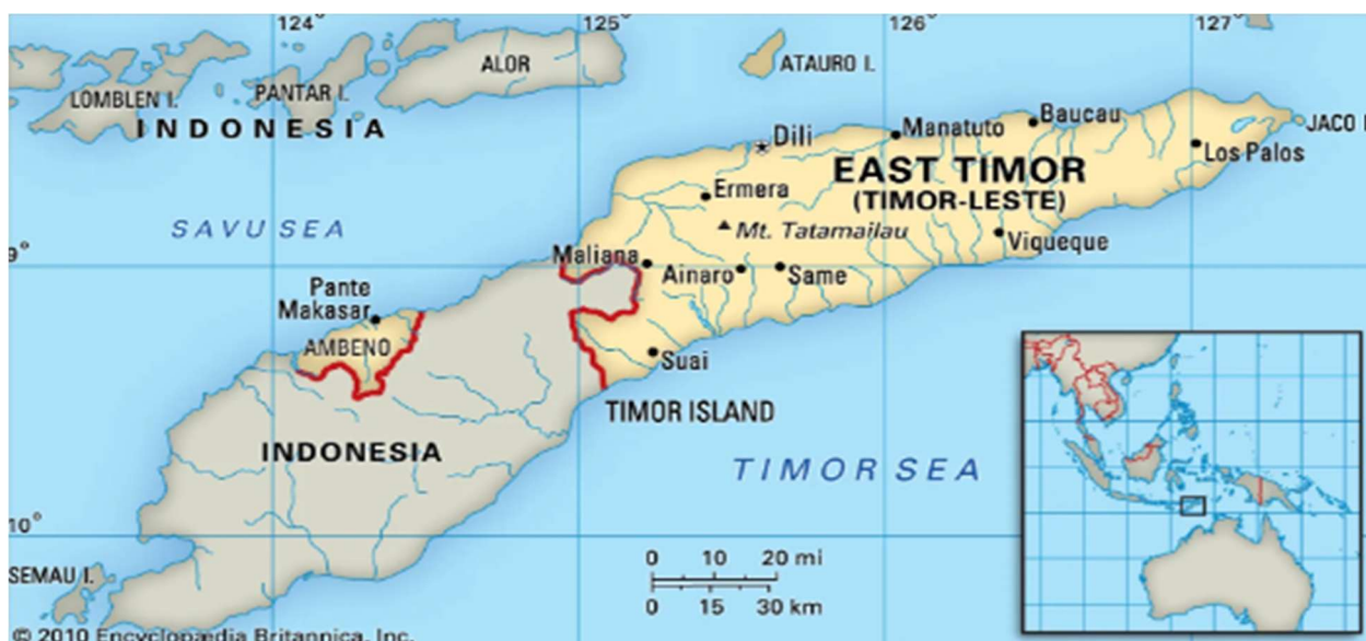
Figura 1 - Mapa de Timor-Leste mostrando os principais centros populacionais deste país no extremo leste da ilha de Timor, no Mar de Timor