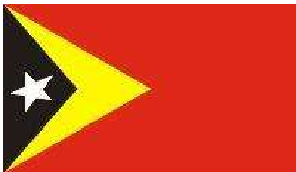
Figura 4 – Bandeira do Timor-Leste