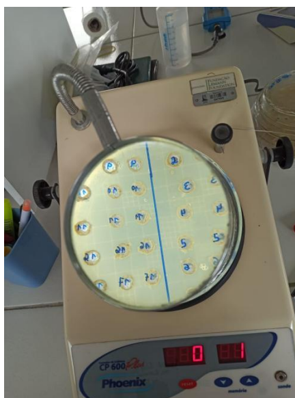
Figura 3: Teste de tolerância a etanol no Complexo Agroindustrial, Universidade Estadual da Paraíba (UEPB), Laboratório de Microbiologia dos Alimentos, Lagoa Seca, Paraíba, Brasil.

inoculadas em meio de cultura Ágar YPG 2% com adição de etanol antes de verter o meio nas placas de Petri. O volume de etanol adicionado no meio foi de 10%, 14% e 18%. As placas foram montadas em triplicata seguindo o esquema de poços descrito anteriormente. Instalou-se placas controle com o meio Ágar YPG 2% sem adição de etanol. As placas foram incubadas em estufa microbiológica por 48 horas a 30°C. As cepas que atingiram desenvolvimento igual ou aproximado ao observado no controle foram consideradas tolerantes à concentração testada. Selecionou-se as leveduras que demonstraram tolerância no volume mínimo de 14% do teor alcoólico, para seguir para o teste final (Crescimento a 37 °C).