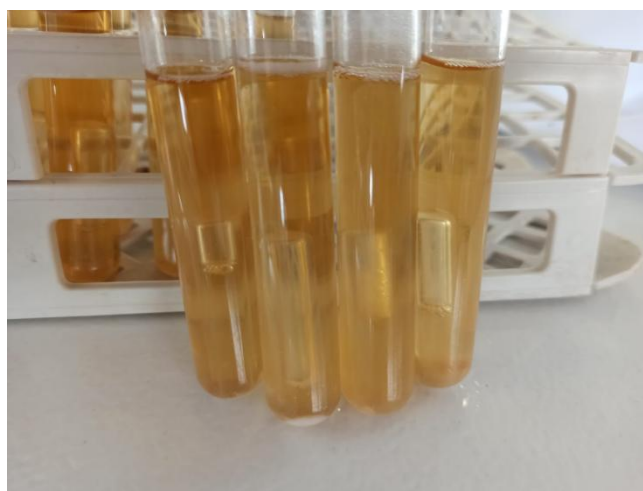
Figura 2: Teste de fermentação de glicose com tubos de Durham introduzidos em tubos de ensaio, no Complexo Agroindustrial, Universidade Estadual da Paraíba (UEPB), Laboratório de Microbiologia dos Alimentos, Lagoa Seca, Paraíba, Brasil.

A fermentação foi mensurada pela produção gradual de gás nos tubos, atribuindo os valores +1, +2 e +3 conforme a proporção de gás acumulado nos tubos de Durham. Esses valores são atribuídos visualmente, sendo +1 quando o volume de gás corresponde a 1/3 do tubo, +2 correspondendo a 2/3 e +3 quando o tubo estava completamente cheio (Figura 1).